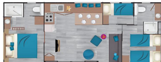
Mobil Home 40m2 (2018)