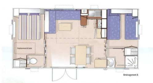
Mobil Home 28m 2 (2004 rénové 2014)